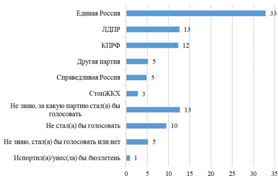
График 3: Готовность голосовать (по данным вопроса «Какую из политических партий Вы готовы поддержать на выборах в Государственную Думу, если выборы состоятся в ближайшее воскресенье?», один ответ, в %% от числа всех опрошенных)

Доля россиян, готовых поддержать новую партию, чуть выше среди молодежи в возрасте 18-24 года лет (4,2%) и жителей Москвы (5%). (см. График 3).